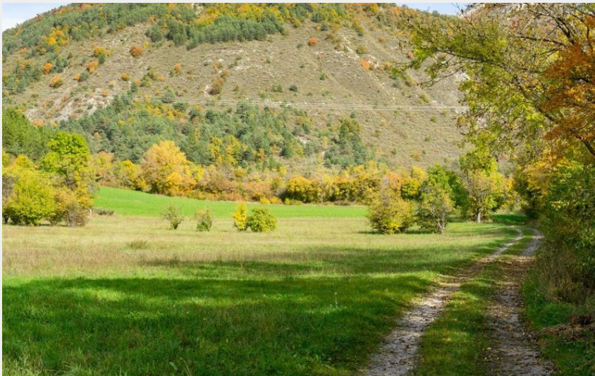
Le Saix piste Donnaves