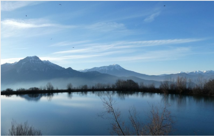
Lac de Saint-Apollinaire (Jennifer Noris)