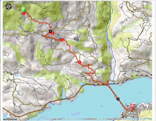
Lac de Serre-Ponçon - Eglise de Saint-Apollinaire (Joelle Noguier)

Étape qui permet de rejoindre Savines-le-Lac en empruntant le GR®653D, chemin de Saint-Jacques-de-Compostelle. Très jolies vues sur l'église de Saint-Apollinaire, le lac et les sommets.