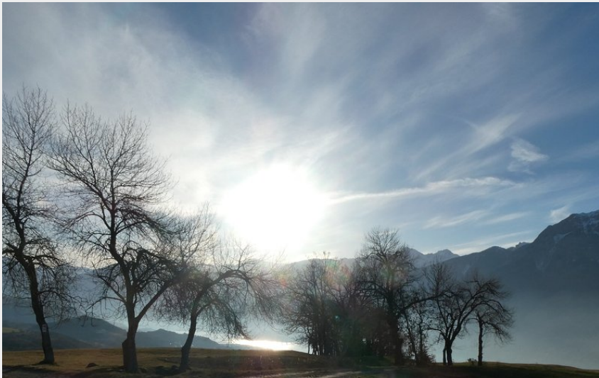
Entre Chorges et Savines-le-Lac (Jennifer Noris)