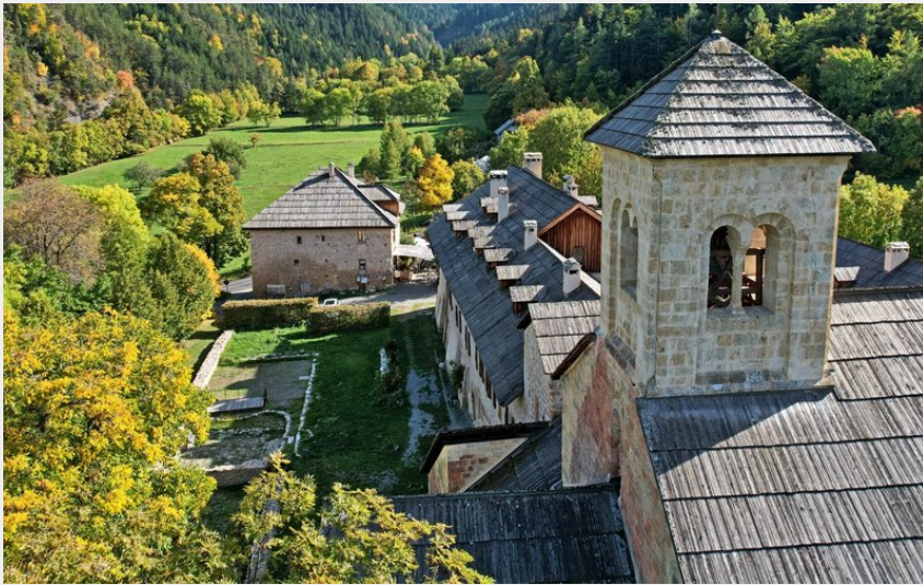
Abbaye de Boscodon (Norman Lancelot)