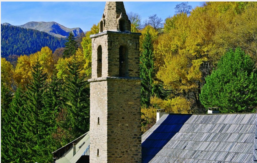
Abbaye du Laverq (Norman Lancelot)